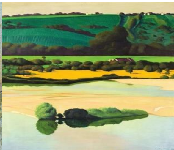
Des sables au bord de la Loire (1923) Collection Privée Vallotton Félix Édouard (1865-1925)

La Magie Résonnante des Sonneries fait Frissonner et Vibrer de Plaisir Les Émotions.