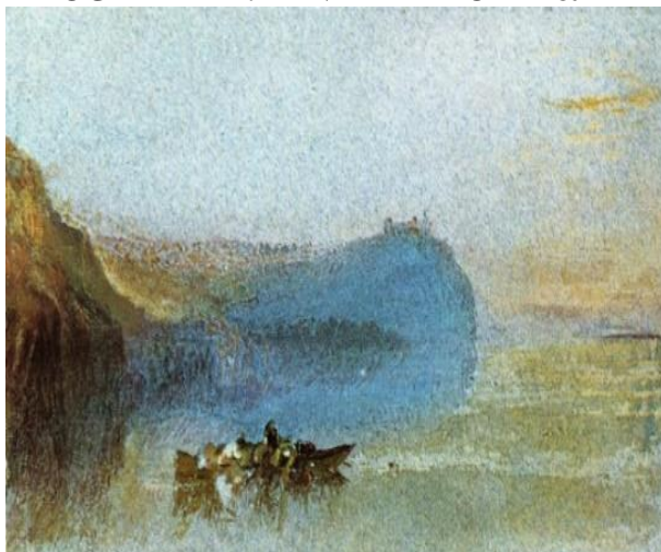
Scène de la Loire (1830) National Gallery, Londres Turner William (1789-1862)

PROGRAMME : LE VAL DE LOIRE & L'ART MUSICAL DE SONNER DE LA TROMPE