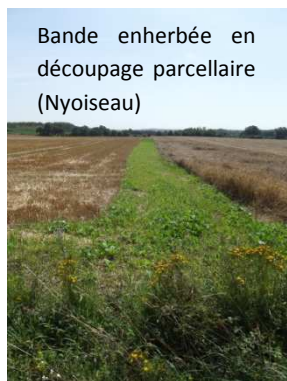
Bande enherbée en découpage parcellaire (Nyoiseau)