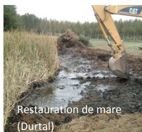
Restauration de mare (Durtal)