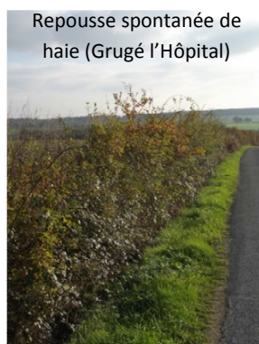
Repousse spontanée de haie (Grugé l'Hôpital)