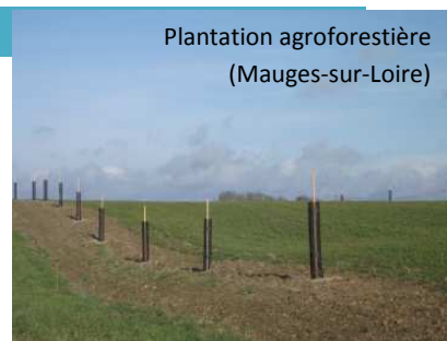
Plantation agroforestière (Mauges-sur-Loire)