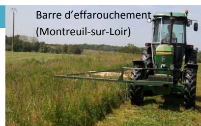
Barre d'effarouchement (Montreuil-sur-Loir)